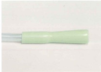
ユニバーサルコネクター